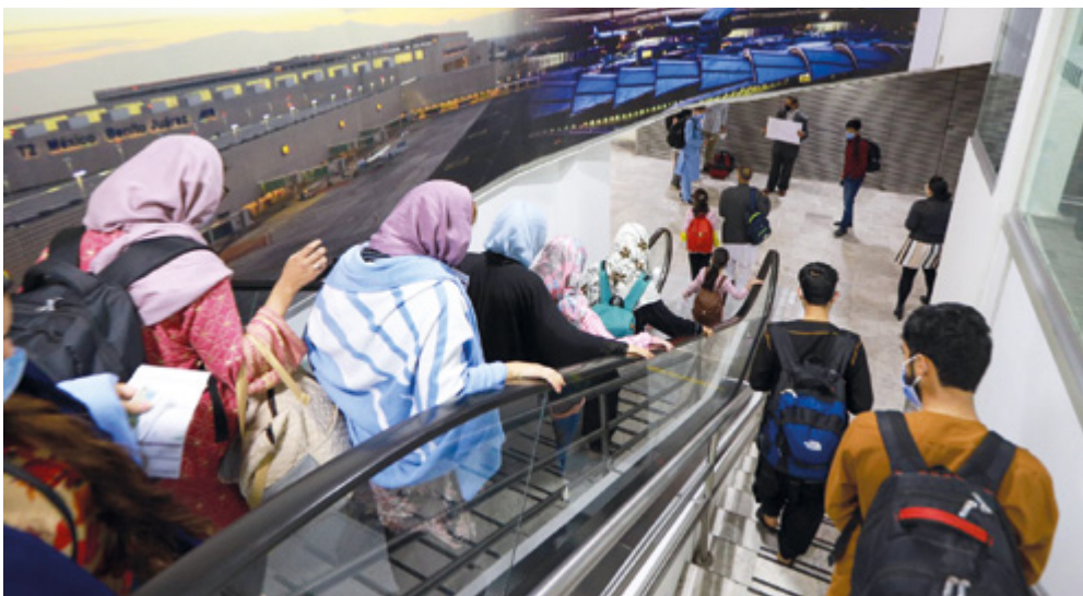
Integrantes del cuarto grupo de personas afganas en la terminal aérea de la Ciudad de México (31 de agosto de 2021).