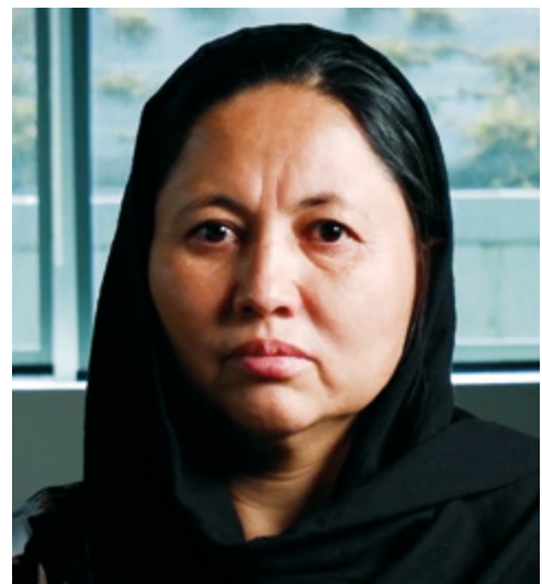
Lejos del peligro, entre la melancolía y la esperanza.