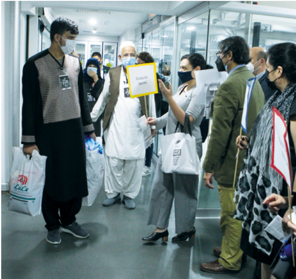
A salvo en nuestro territorio.