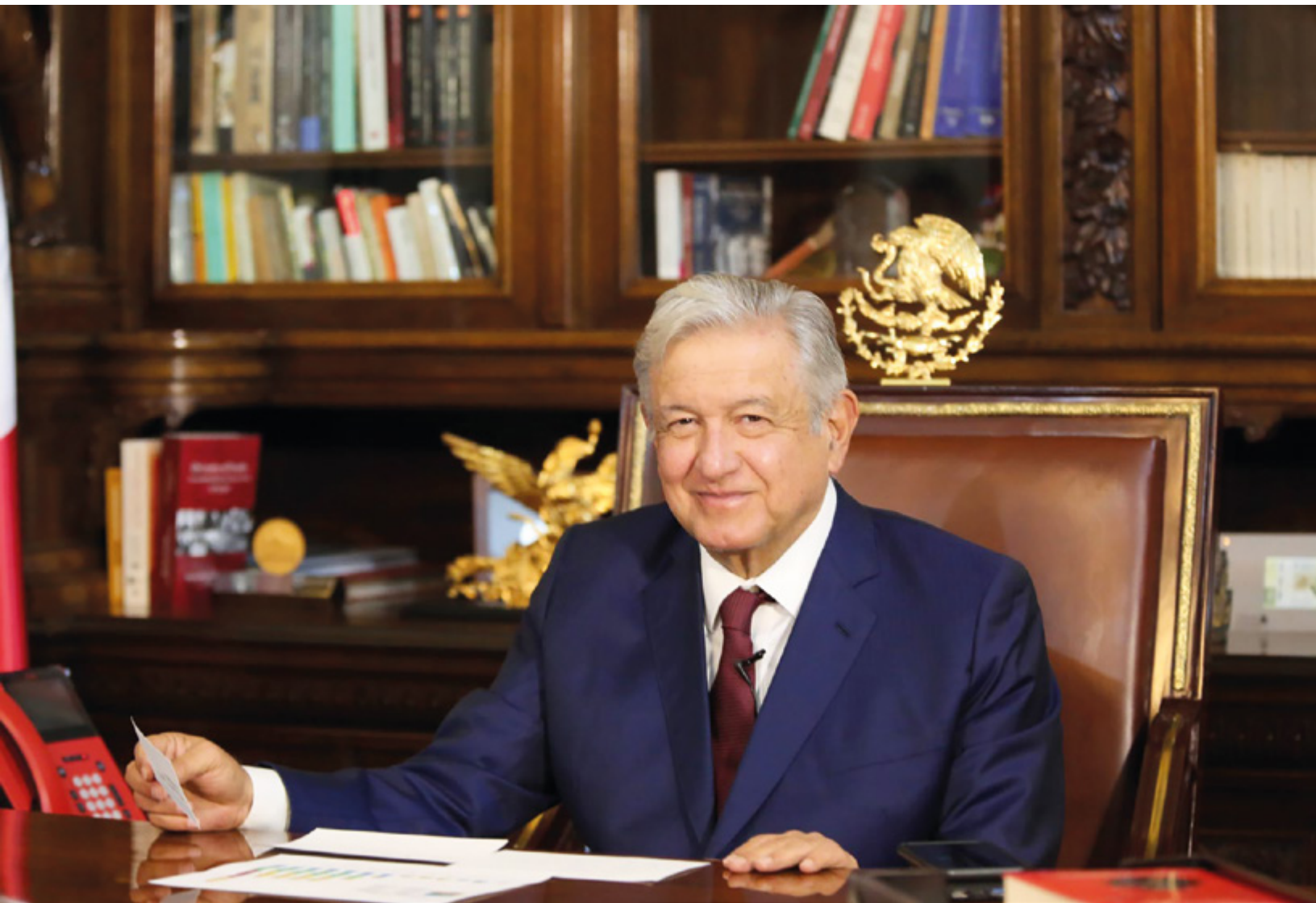
Licenciado Andrés Manuel López Obrador, Presidente Constitucional de los Estados Unidos Mexicanos