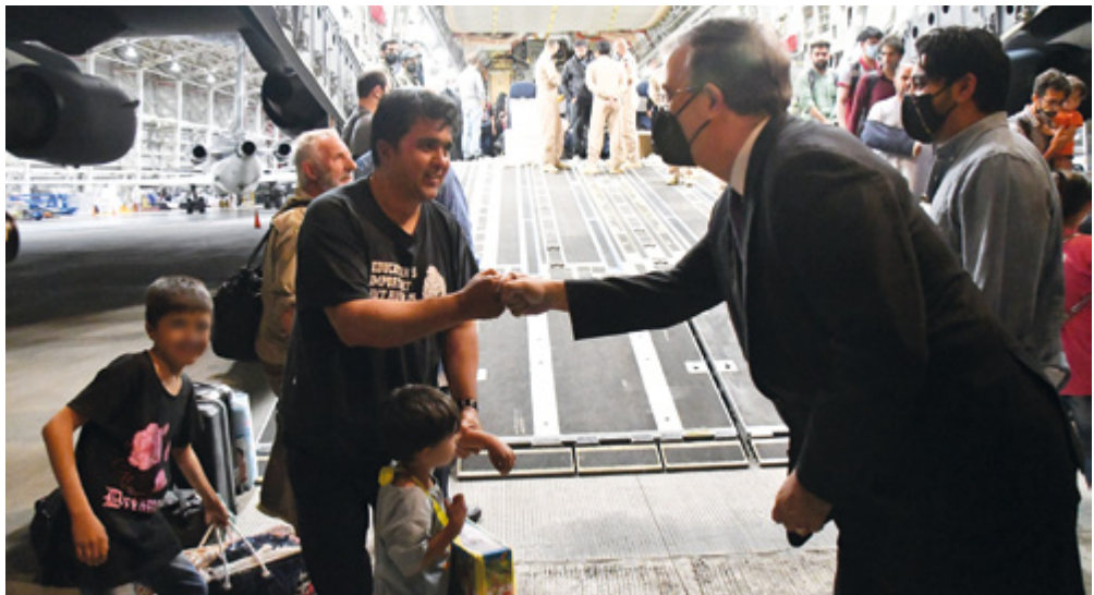
Escenas de alivio y alegría.