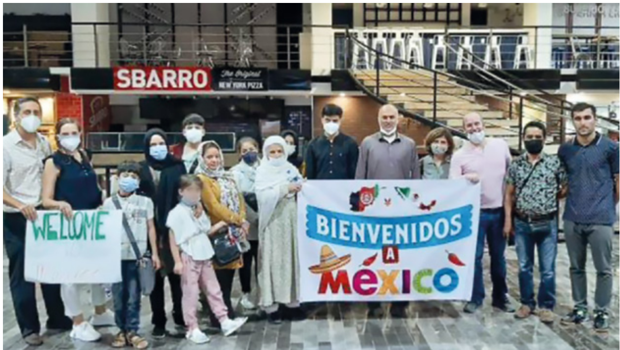
Recepción de nacionales de Afganistán en el aeropuerto capitalino.