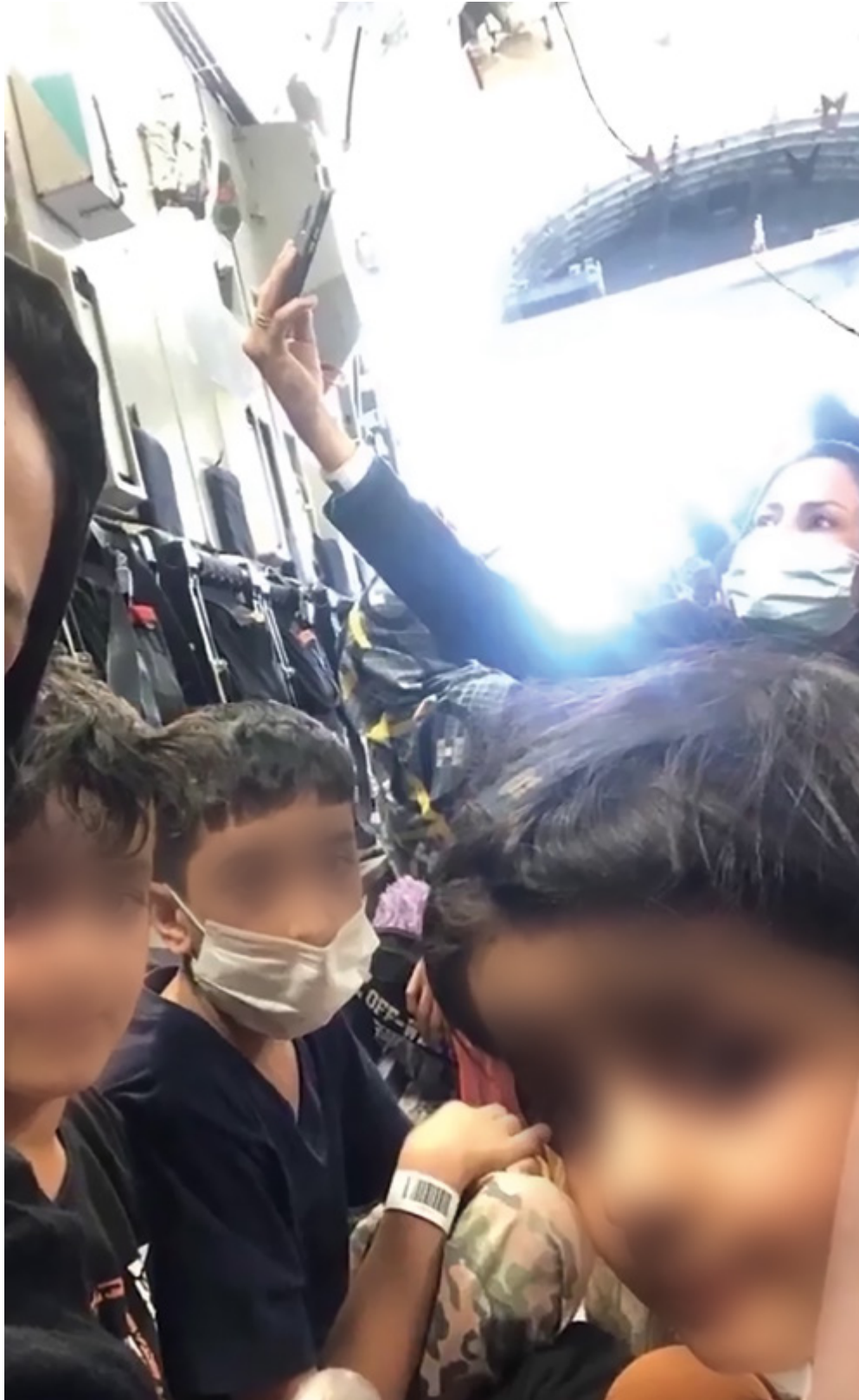
Aunado a su propia seguridad, las jóvenes se mostraban preocupadas por la de sus seres queridos.