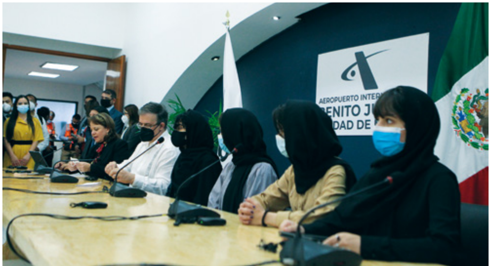
Después del largo camino, una cálida bienvenida.